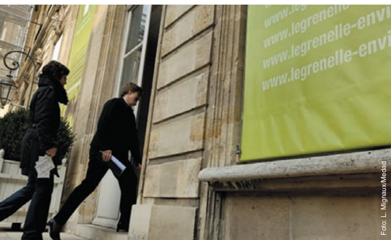
De 'Grenelle de l'Environnement' zorgde in Frankrijk voor een echte politieke aardbeving